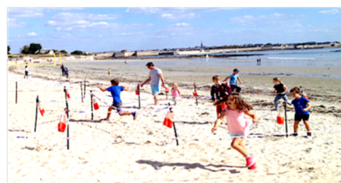
Du plaisir pour tous les publics

Cette formation peut nécessiter un accompagnant pour les personnes en situation de handicap. Tarif sur devis – Délai d'accès de 6 mois en moyenne – Document mis à jour 2024