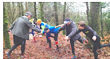
Le travail des capacités physiques

Les partages d'idées et d'outils sont particulièrement appréciés. Pensez à amener vos cartes et problématiques, pour tracer « utile ». Nous prenons le temps de découvrir les outils OCAD et SI pour l'animation. Avec un objectif de gain de temps dans vos préparations et de succès.