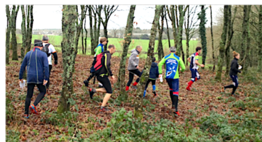
Dans les milieux naturels