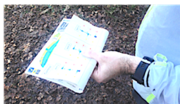
Le travail des techniques d'orientation